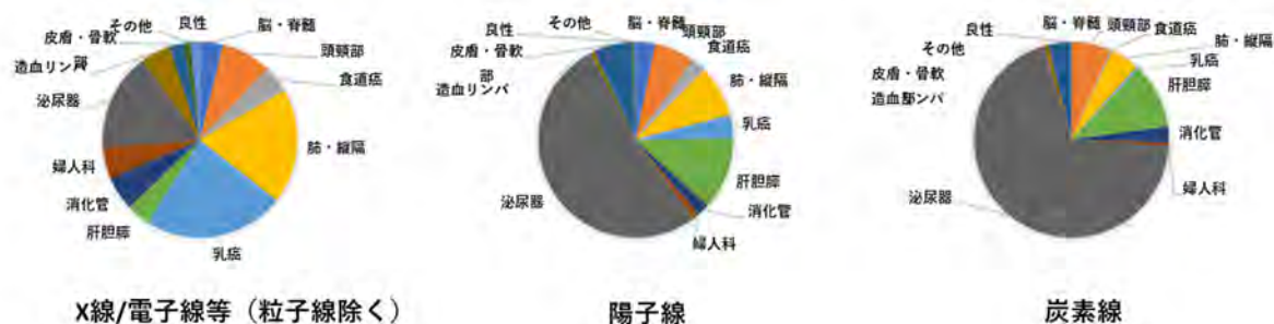
図2. 原発巣別新規患者数